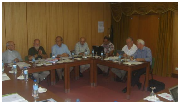
Comité Ejecutivo e GLCC