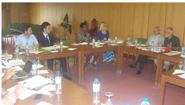
APG e NACG

Dando início à sessão de trabalhos foram apresentados os diversos assuntos e tomadas as resoluções já referidas, sempre tendo em perspectiva a harmonia, unidade e singularidade do Movimento em todo o mundo.