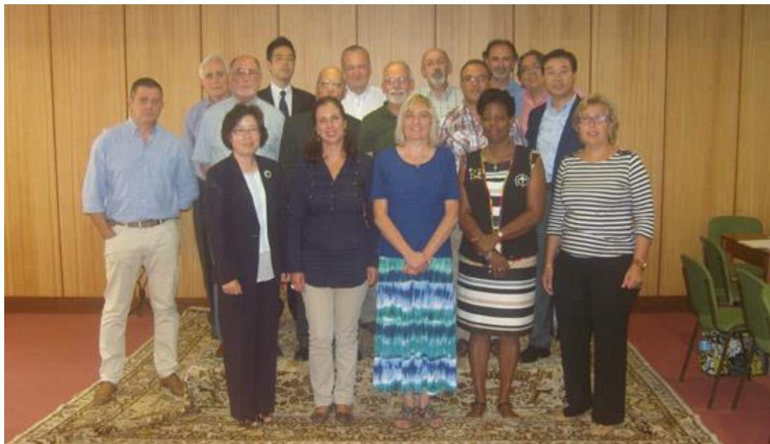
Participantes na Reunião Internacional do OMCC

Os Grupos Internacionais irão elaborar uma lista com os nomes e endereços electrónicos de todos os presidentes e assistentes espirituais de cada Secretariado Nacional, e solicitar que o mesmo seja feito relativamente aos Secretariados Diocesanos;