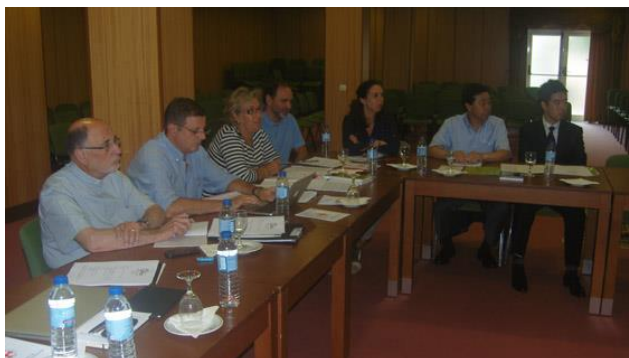
GECC e APG

TODA A CORRESPONDÊNCIA PARA: OMCC.PORTUGAL@GMAIL.COM WWW.ORG MCC.ORG