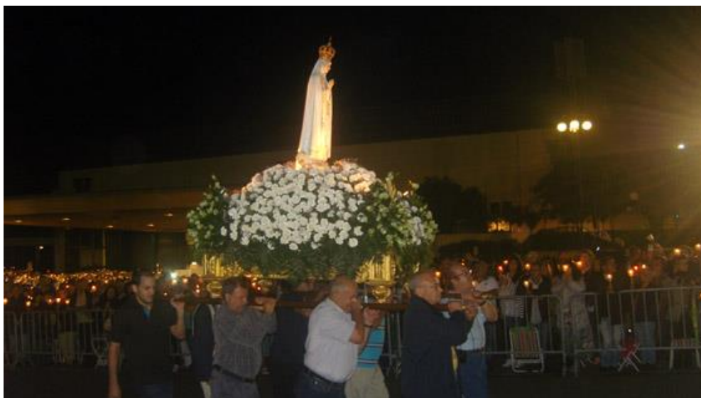
Fátima – Procissão das velas

Setembro foi um mês muito importante para a Organização Mundial e para todo o Movimento, pois que em Fátima, nos dias 12 e 13, se realizou uma reunião com os Grupos Internacionais onde foram transmitidas informações de enorme repercussão e se tomaram decisões que irão orientar o MCC nos próximos anos.