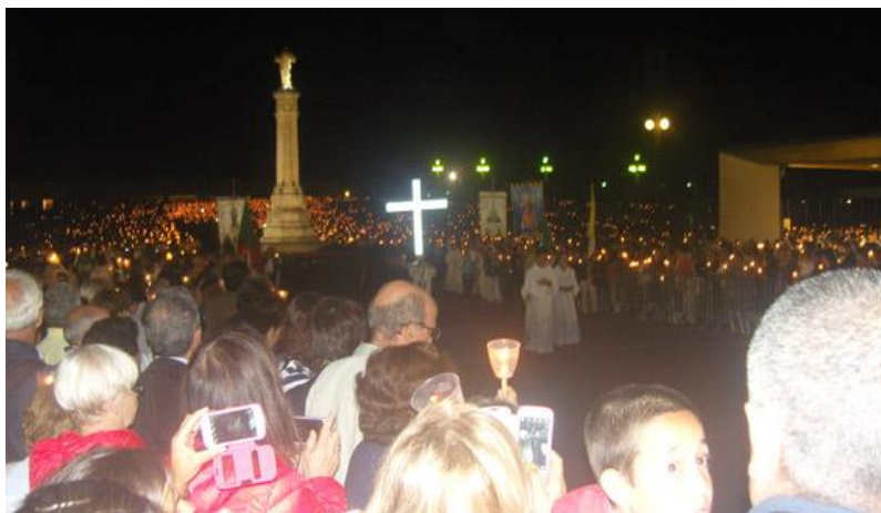
Fátima – Procissão das velas

O dia continuou com a participação na Eucaristia celebrada na Capelinha das Aparições e pelas cerimónias da procissão Eucarística e, à noite, recitação do Rosário e procissão das velas.